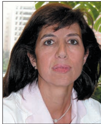
Dirección de Enfermería