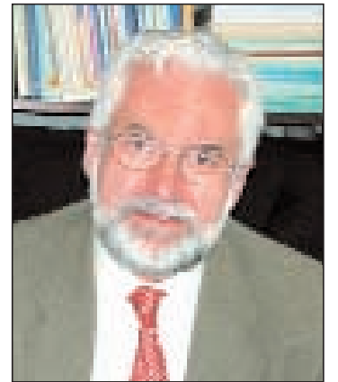
Dirección de Gestión