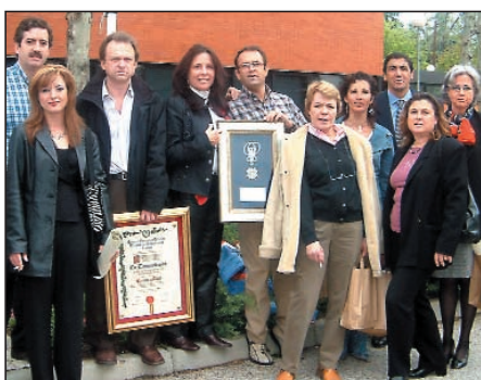
Representantes del colectivo de Enfermería.