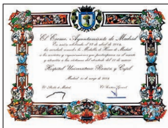
Medalla de Honor.

Los padres de la enfermera fallecida en el atentado agradecieron las muestras de cariño que han recibido.