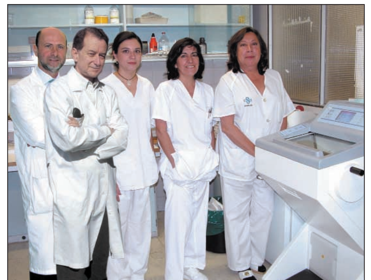
Equipo de Dermatología, Cirugía Plástica y Anatomía Patológica encargados de la realización de la Cirugía de Mohs en el Hospital Ramón y Cajal