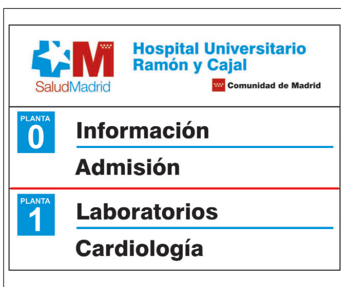
Simulación del nuevo plan de identidad visual aplicado al Hospital Universitario Ramón y Cajal.

La incorporación de la nueva imagen corporativa se realizará en el hospital de forma paulatina, evitando el consumo innecesario de recursos. Las dotaciones de material todavía existentes se utilizarán hasta su finalización.