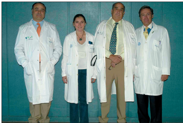
Componentes del Servicio de Cirugía Cardíaca Infantil.

Este servicio está estructurado en las áreas de hospitalización, quirófanos, cuidados intensivos y consultas externas. Es una unidad funcional junto al Servicio de Cardiología Pediátrica y la Sección de Anestesia-Reanimación. "Queremos garantizar el control