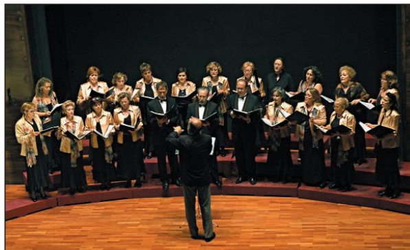
Coral Polifónica Instituto de Salud Carlos III.