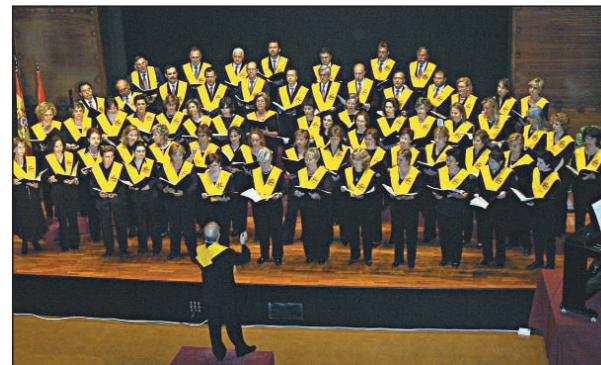
Coro del Alba Gregoriana.