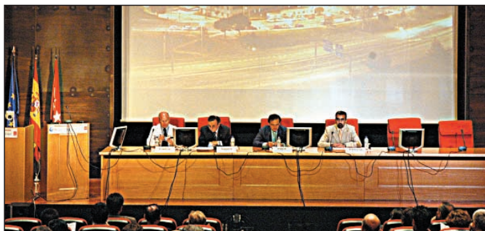
Inauguración de la jornada sobre emergencias en instalaciones radiactivas.

Organizadas por la Sociedad Española de Protección Radiológica, el Consejo de Seguridad Nuclear y el Servicio de Protección Radiológica de los hospitales La Paz y Ramón y Cajal, los días 6