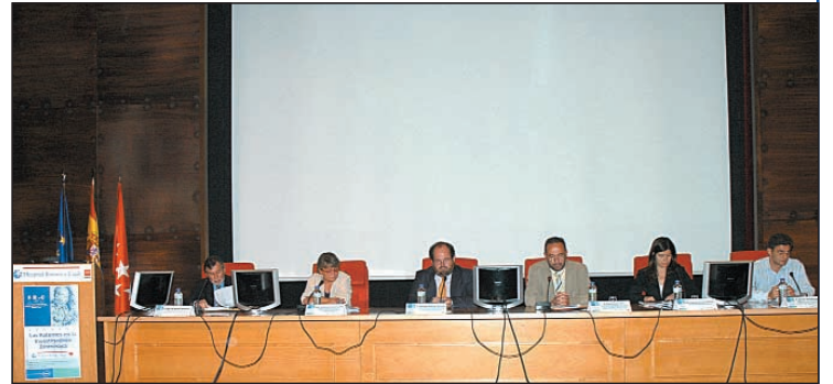
Imagen de la mesa presidencial durante la celebración de la jornada.

“Actualmente nuestros investigadores trabajan jun-