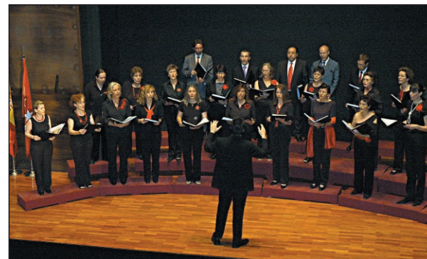
Coro Área Sanitaria 11.

El Encuentro de Corales Hospitalarias ha reunido en el Hospital Ramón y Cajal a los coros de los centros sanitarios Carlos III, Doce de Octubre, Gregorio Marañón, La Paz y Ramón y Cajal. Este Encuentro se ha convertido en un referente entre las actividades que reúnen a profesionales de hospitales de la Comunidad de Madrid. El intercambio de experiencias entre centros sanitarios es continuado en materias docentes e investigadoras, pero no es habitual en actividades de carácter cultural y social. Por este motivo, los Encuentros de