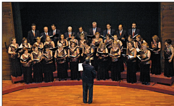
Coral Polifónica La Paz.