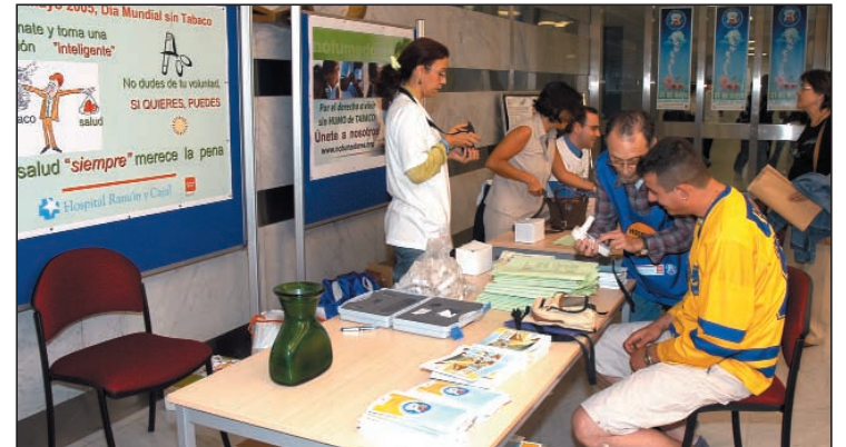
Realización de una coximetría para medir el nivel de monóxido de carbono en pulmón.