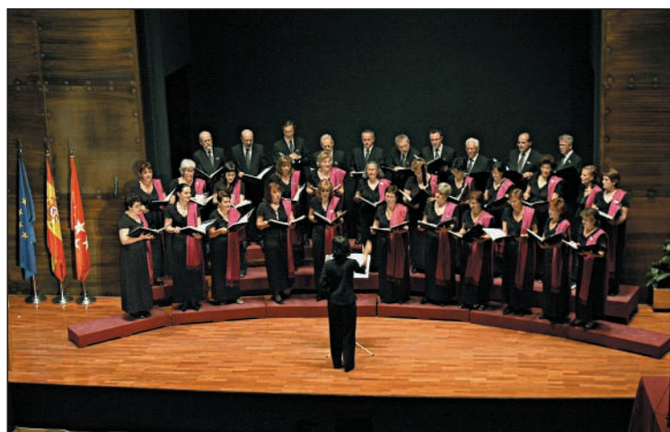
Coro Ramón y Cajal.