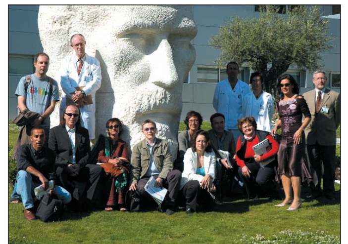
Los participantes del programa HOPE que han visitado el hospital se fotografiaron ante la estatua de Ramón y Cajal.

de las iniciativas sobre seguridad del paciente, tema central del programa HOPE de este año.