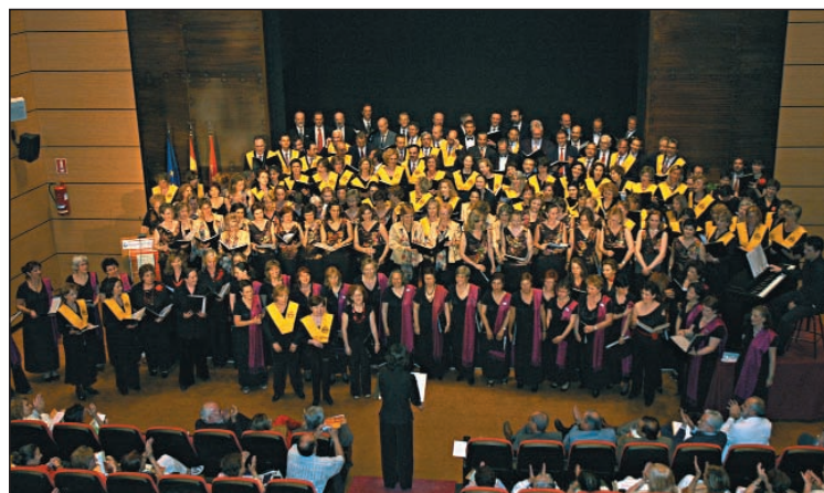
Actuación conjunta de las corales participantes.