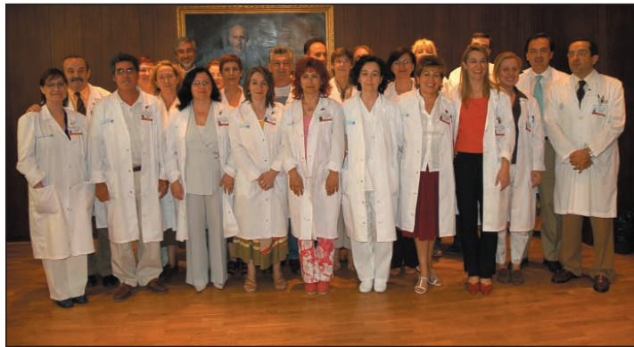
Componentes de la nueva Unidad de Información al Usuario.

La Unidad de Información al Usuario está formada por profesionales que orientarán y acompañarán a las