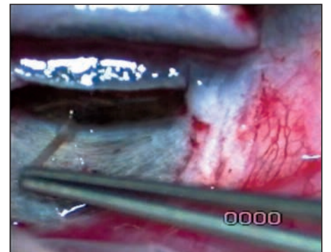
Extirpación de la pared interna del canal de Schlemm durante la realización de una esclerectomía profunda no perforante

Dada la dificultad en la curva de aprendizaje de la esclerectomía profunda no perforante, son pocos los hospi-