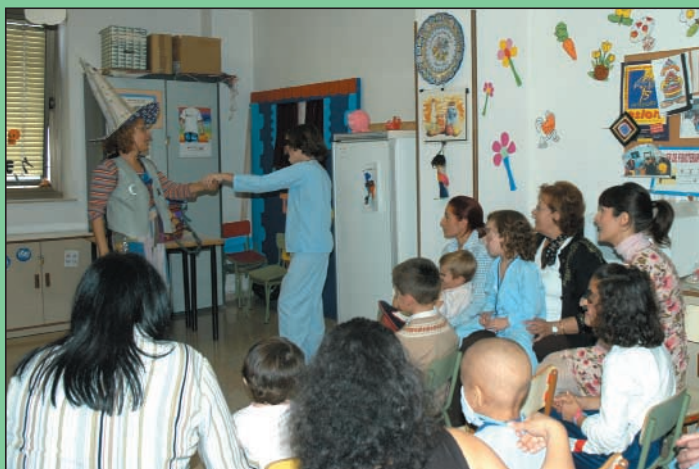
CUENTA-CUENTOS.- Los niños recibieron con ilusión la visita de una "cuenta-cuentos" y disfrutaron de una entretenida mañana con sus historias.