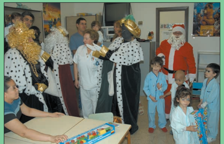
VISITA DE LOS REYES MAGOS.- Los Reyes Magos no faltaron a su cita navideña. Visitaron el hospital y entregaron juguetes a los niños ingresados.