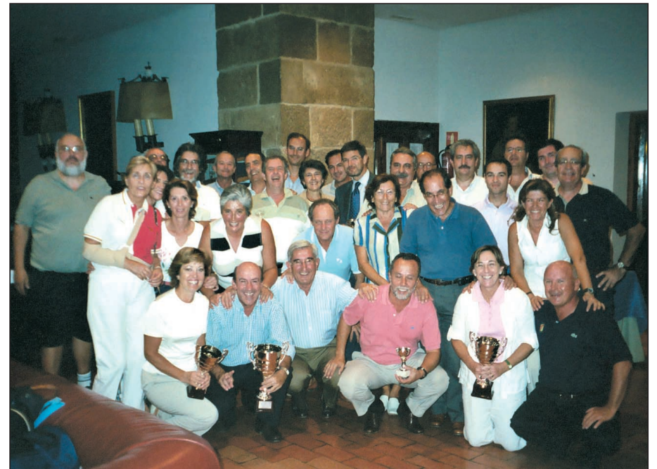
Los participantes en el torneo posaron en los salones del Club La Herrería tras la entrega de trofeos a los gandores.

La Herrería Club de Golf ha acogido la celebración del Torneo de Golf Ramón y Cajal. Participaron treinta y siete profesionales del hospital dispuestos a divertirse en el green y a hacer ejercicio físico. La clasificación del torneo fue la siguiente: