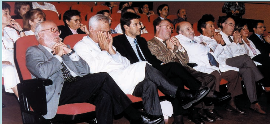
Al acto asistieron la mayoría de los Directores que ha tenido el Hospital a lo largo de su historia y Enrique Sánchez de León, Ministro de Sanidad cuando se inauguró el centro.